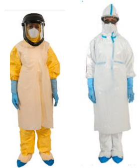
Figure 2. Combinaison intégrale avec APR, lunettes couvrantes/visières, double gants, surchaussures, tablier

Contenu susceptible d'évoluer pour s'adapter à la situation épidémiologique