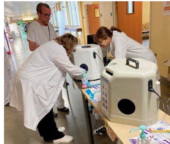
Boîte à coucou