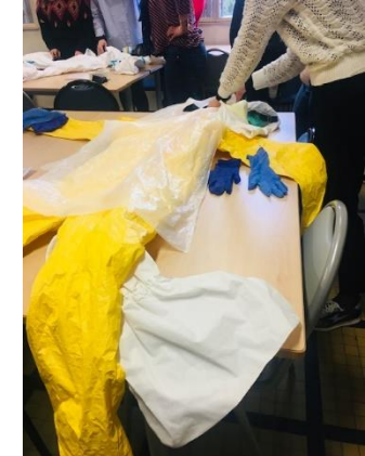
Découverte des EPI