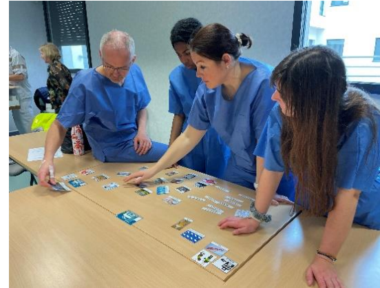
Vignettes parcours REB